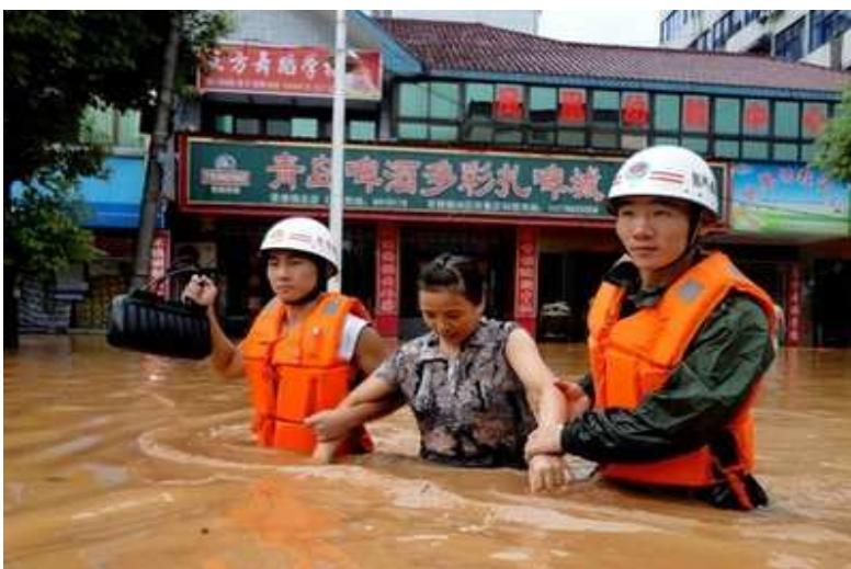
Zwei Soldaten helfen einer Frau. Schwere Überschwemmungen in China sind jährliche Ereignisse.