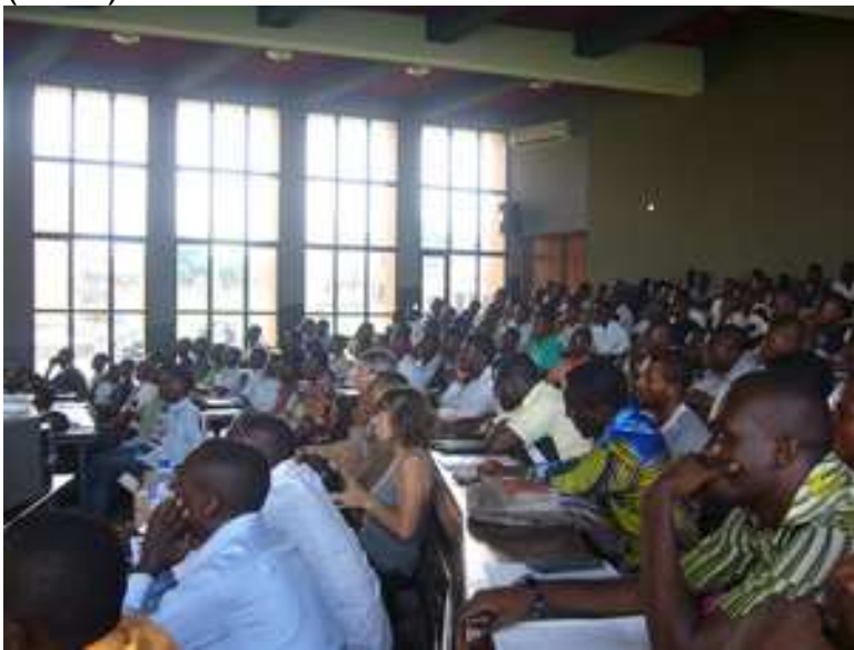
Ausbildung im Wort des Gottes im Kongo.