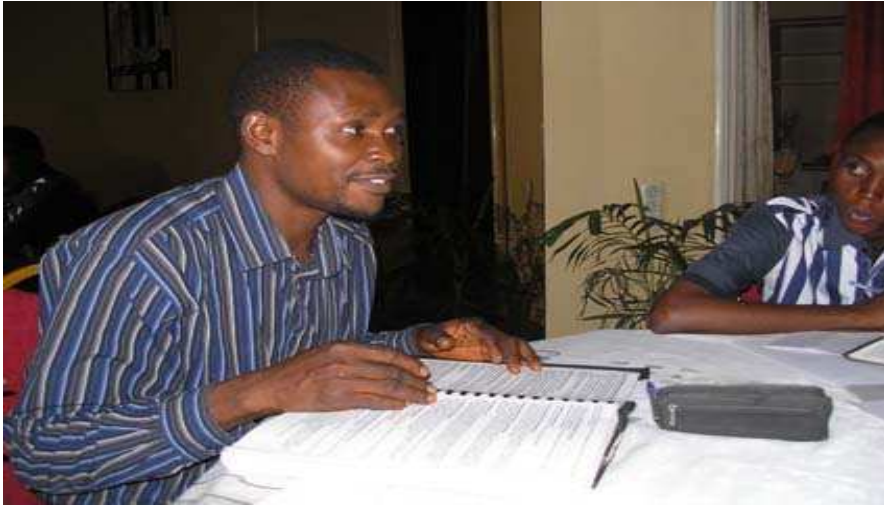
Nationale Bibel Studenten graduieren und lehren andere hier in Kinshasa, Kongo (DRC).