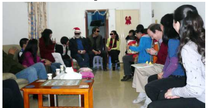
Ein paar unserer Gäste auf der Weihnachtsfeier.

Danach schauten wir einen Zeichentrickfilm, der die Weihnachtsgeschichte gut rüberbrachte - (ein chinesischer Mitarbeiter, hatte den Text für uns aus dem Englischen übersetzt und so fügten wir dem Film, chinesische Untertitel hinzu). Danach, sangen wir Weihnachtslieder, was ihnen wirklich gefiel. Wir hatten ein schlichtes, zweisprachiges Liederbuch gemacht, darin waren einige der traditionellsten Weihnachtslieder und wir sangen sie auf Englisch und Chinesisch. Darauf folgend, sangen wir zusammen „Happy Birthday“ für Jesus und ließen uns eine Geburtstagstorte schmecken; außerdem gab es noch einen Imbiss und Getränke etc. Die jungen Leute wollten noch weitere ‚Action‘, darum hatten wir ein paar unterhaltsame, englischsprachige Spiele in petto, die ihnen echt Spaß machten.